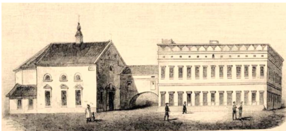
Az Eperjesi Kollégium 2

Nyíregyháza 18–19. századi szellemi életére talán a legnagyobb hatást az Eperjesi Kollégium gyakorolta. Erre predesztináltatott is a közösség, hiszen egyik birtokosa, gróf Károlyi Ferenc 1753-ban felvidéki gyökerekkel rendelkező, békési evangélikus „ tót szabadsad menetelű jobbágycsalád ” telepített ide, a 18. század második felében pedig a Felvidékről közvetlenül és folyamatosan érkező bevándorlókkal gyarapodott az új lakosság. Köztük már nem csak földművesek, hanem kézművesek, értelmiségiek is voltak. Az impopulációs évszázadban a népességnek több mint háromnegyede volt evangélikus, így Nyíregyháza evangélikus szigetként állt a református-katolikus Szabolcs megye közepén.