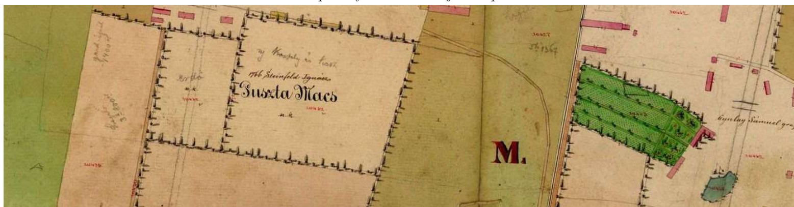
2. kép. Steinfeld birtokközpont 1870–1900 k. 21