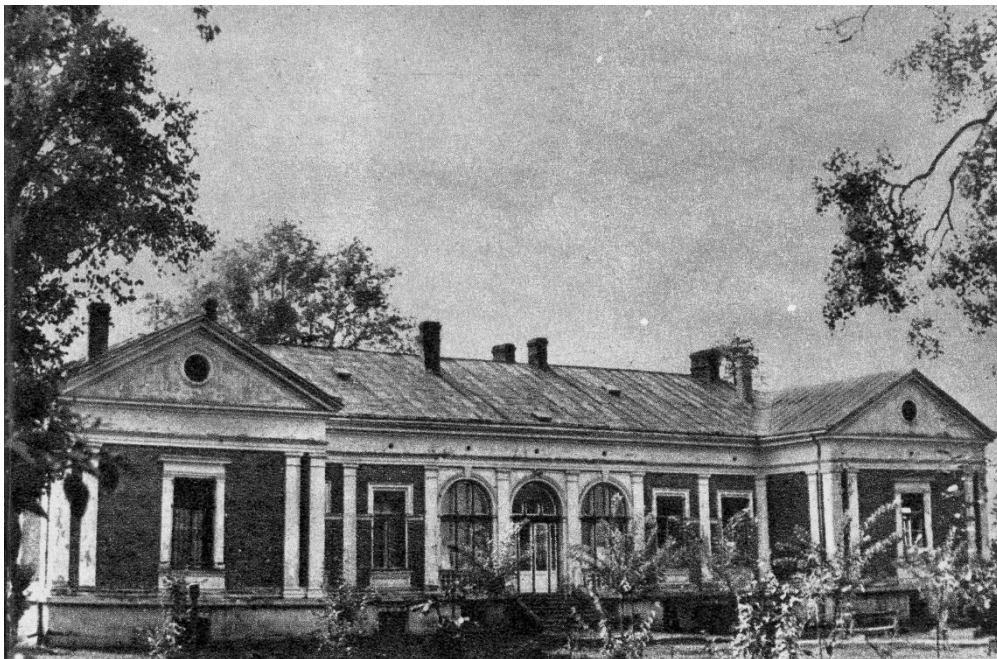
9. kép. Macs uradalmi kastély. 46