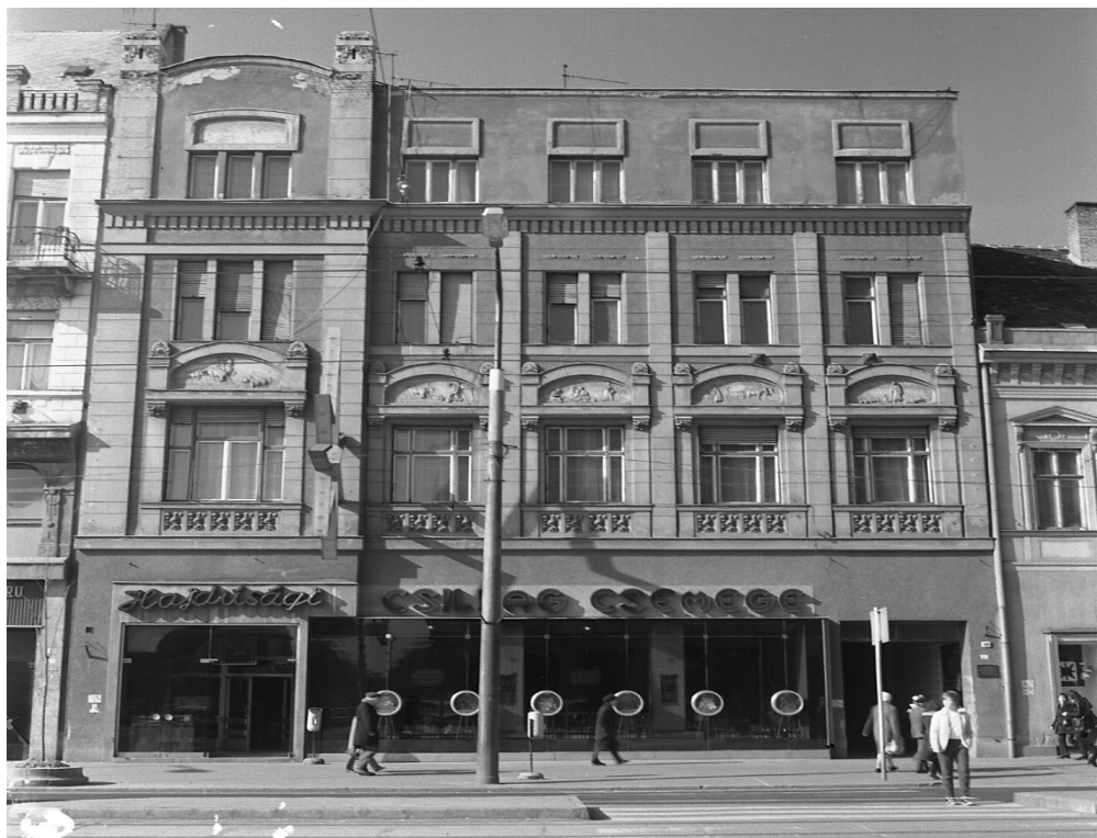
12. kép. Steinfeld bérpalota (1980-as évek). 72