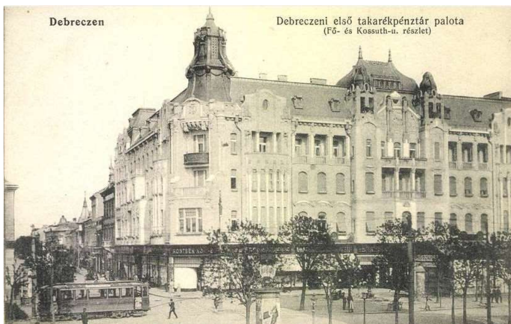
16. kép. A Debreceni Első Takarékpénztár palotája, 1912. 97

Városi Szövetség, az 1939-es választásokon Vásáry azonban már a Kisgazdapárt – a kormánypárt (ekkor már Magyar Élet Pártja néven) legnagyobb ellenfele – színeiben indult.