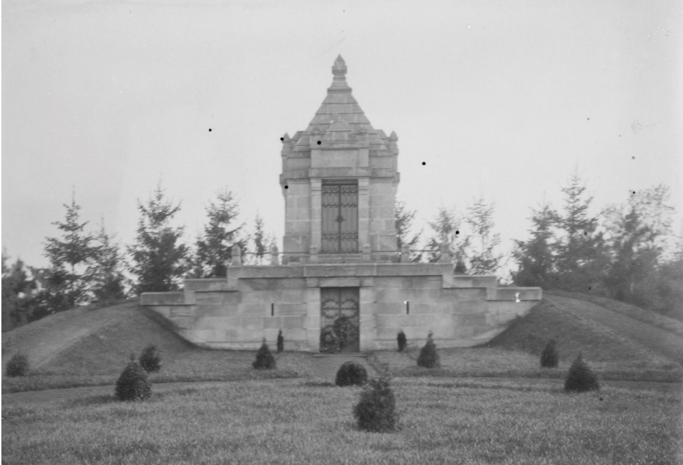
10. kép. A Steinfeld kastély kriptája. 61

Temetéséről a következőképpen tudósítottak: