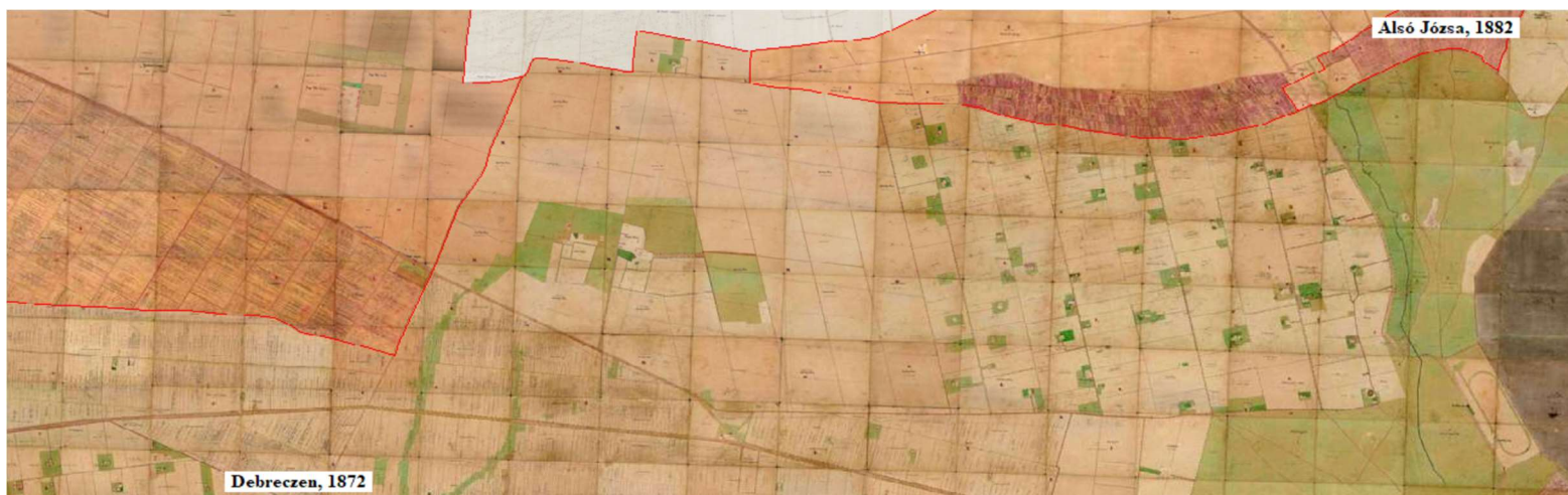
1. kép. Steinfeld birtok kataszteri térkép. 20