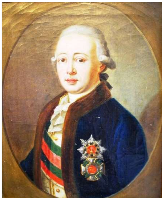
4. kép. Bánffy György gubernátor.

Csáky Kata leveleinek második csoportja egyértelműen Bánffy György gubernátorhoz (1787–1822), Bánffy Dénes idősebb fiához szól.