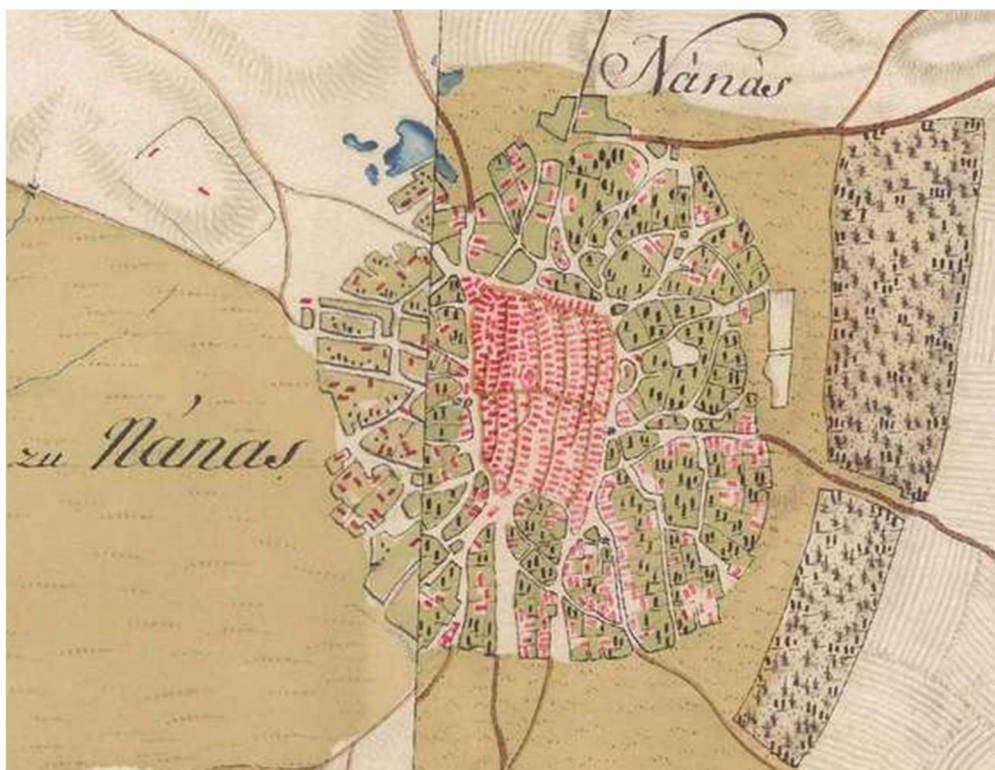
1. kép. Hajdúnánás belterületének jelölése az első katonai felmérés térképén. 15

Az előbbiekben bemutatott folyamat társadalmi konfliktusokat idézett elő, megváltoztatta a birtokviszonyokat, mely egyértelműen kihatott a településszerkezetre is. Témánk szempontjából a kertészek betelepülésének településszerkezetet megváltoztató hatása a fontos, így a továbbiakban ez kerül bemutatásra. A folyamat a kertészek területének megnövekedését eredményezte, így egyre több mezőgazdasági munkafolyamat szorult ki a város e területére, többek között a malmok és a vermek is ide kerültek. 14