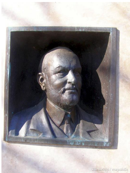
3. kép. Hegymegi Kiss Pál emlékműve. 66