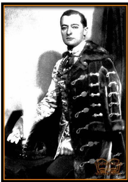
2. kép. Bárány László, Hajdú vármegye főispánja 1932–1937. 22