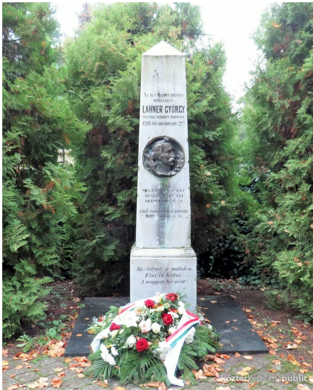
2. kép: Lahner György emlékoszlopa szülőhelyén