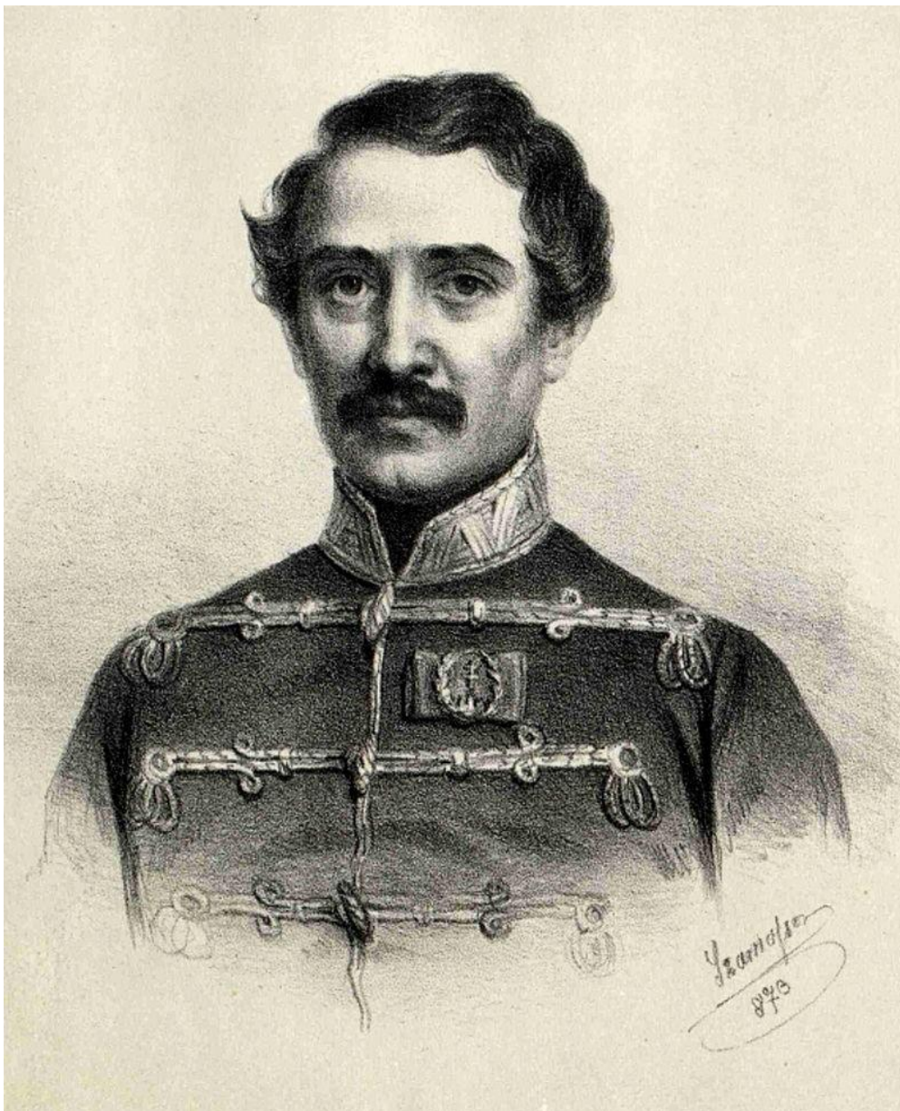
1. kép: Láhner György – Szamosy Elek litográfiája