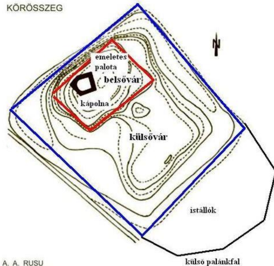
4. kép. Körösszeg várának alaprajza (Adrian Andrei Rusu), amely az 1635. évi inventárium korabeli állapotokat mutatja. 54

Csáky erdélyi birtokainak visszaadását az I. Rákóczi Györggyel Eperjesen, 1633. szeptember 28-án kötött békemegállapodás 9. pontja alapján határozta meg. 52 A megállapodás viszonyosságon alapult: a magyar király amnesztiát adott a fejedelem híveinek, viszont a fejedelemnek is engednie kellett az ellene korábban fondorkodók büntetésén, „ minélfogva Prépostváry, Csáky és a többiek bántatlanul visszatérhessenek, s birtokaikba visszahelyeztessenek ”. 53