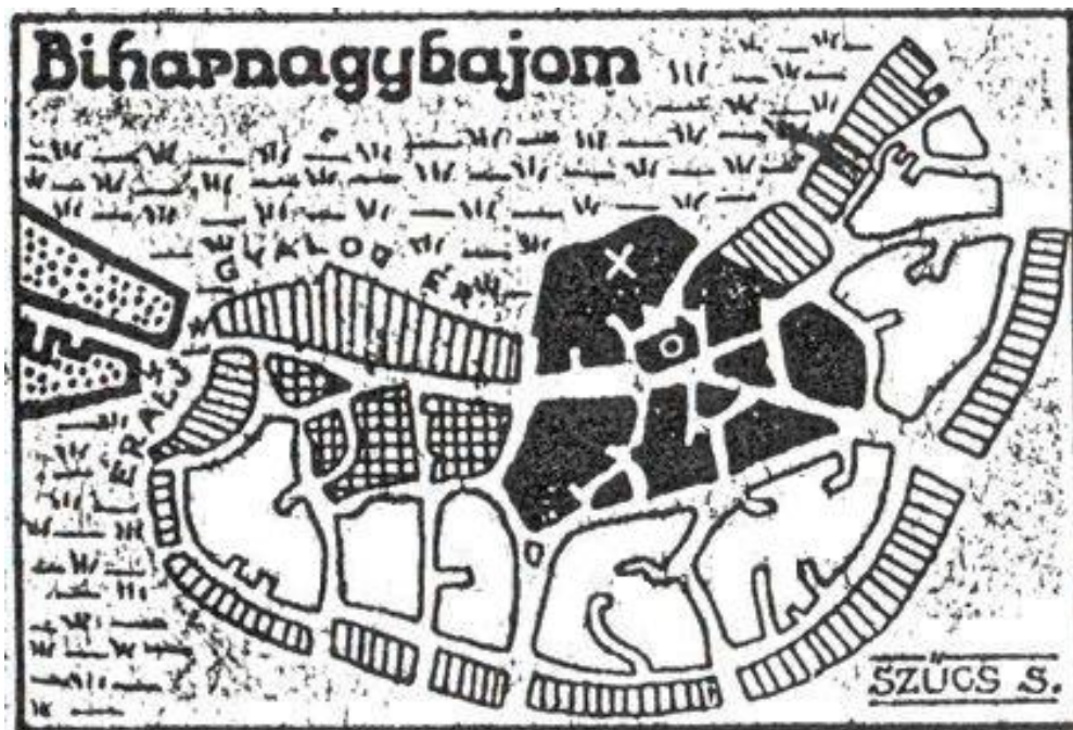
1. kép. A bajomi vár.

forint zsoldot 1608. március 30-án, még a Báthory Gábor javára történt lemondása előtt. 17