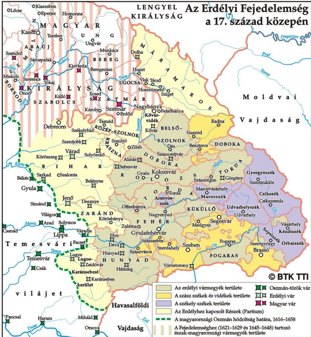
6. kép. Várak az Erdélyi Fejedelemségben I. Rákóczi György idején. 71